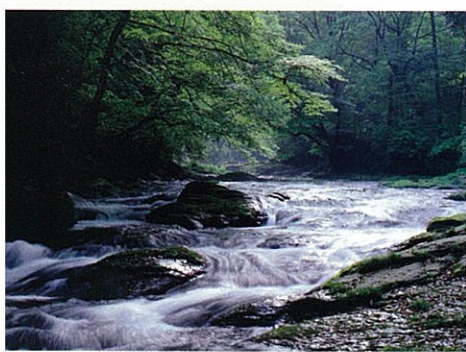
菊池川の源をなす菊池溪谷。湧き出る水が清冽な流れを作り、四季折々の自然美を見せる。秋は紅葉の名所だ。