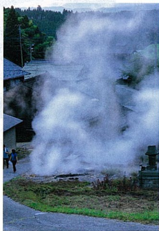
わいた温泉郷では至る所から蒸気が噴出している。この蒸気を利用した料理も名物だ。