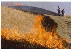
野焼きは早春の阿蘇の風物詩。これによって、何百年の間、草原の環境は守られてきた。

阿蘇の草原は、地元の人たちが草を利用して牛馬を飼うために手入れしてきた自然環境だ。