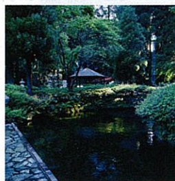
白川水源。阿蘇を代表する湧水で、吉見神社の緑が清々しく、あたりには夏もひんやりと涼気が漂う。

実は、熊本は名にしおう湧水王国。日本名水百選には昭和に4カ所、平成に入って4カ所、計8カ所が選定されている。これは富山と並んで日本一！この豊富な湧水は阿蘇山がもたらしている